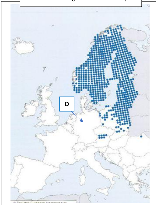
Die Verbreitung des Elchs in Europa